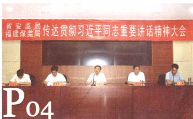
P04 9月14日上午,省安监局、福建煤监局召开会议传达学习国家副主席习近平来闽考察重要讲话精神……