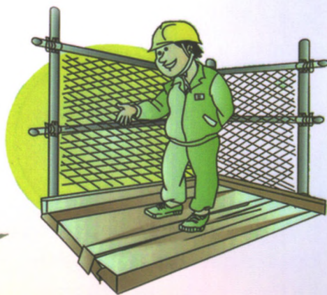
平台四周要有高 1-1.2m的防护栏杆, 栏杆外挂密目网封闭。