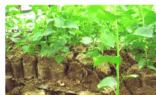
马哈利砧木-专利育苗技术