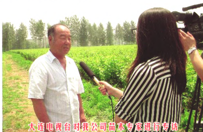
大连电视台对我公司苗木专家进行专访