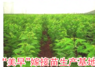
“美早”嫁接苗生产基地