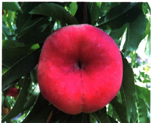
瑞蟠 25 号