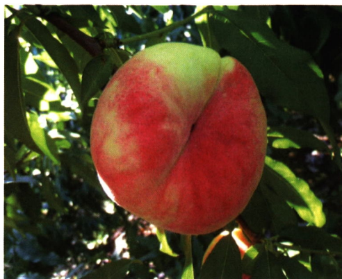
瑞蟠 21 号