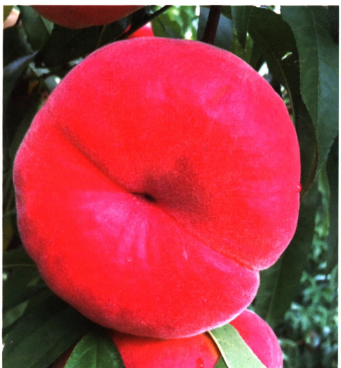
瑞蟠 101 号