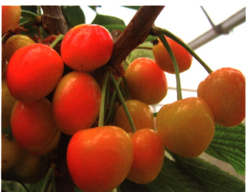
香泉 1 号