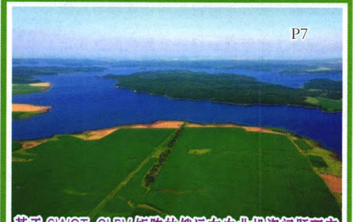
基于SWOT-CLPV矩阵的俄远东农业投资问题研究