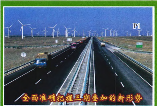
全面准确把握三期叠加的新形势