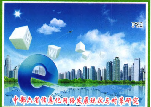
中部六省信息化网络发展现状与对策研究