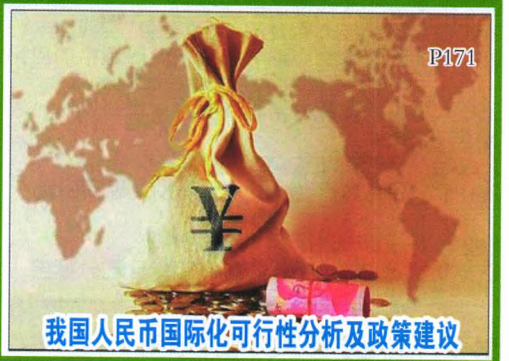
我国人民币国际化可行性分析及政策建议