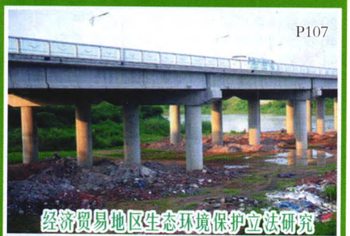
经济贸易地区生态环境保护立法研究