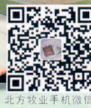
北方牧业手机微信