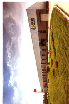
国际家禽孵化中心

华裕拥有30个养殖基地，年引进海兰系列祖代种鸡10万套进行引繁推一体化作业，现饲养祖代种鸡12万套，父母代种鸡300万套，年可生产雏鸡2.5亿只，已成为具有世界影响力的蛋种鸡领军企业。公司凭借出色的业绩和优秀的产品品质，先后荣膺“农业产业化国家重点龙头企业”、“国家高新技术企业”等多项荣誉。