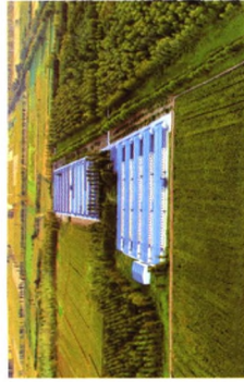
华裕现代农业养殖示范园