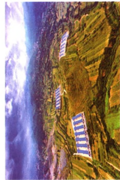
河北涉县养殖基地