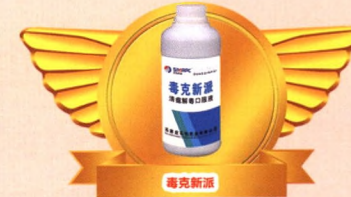
霉克新泽 石家庄石牧药业有限公司