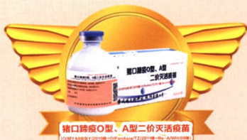
猪口蹄疫O型、A型二价灭活疫苗 中农威特生物科技股份有限公司