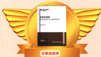
甘草百部灵 石家庄石牧药业有限公司