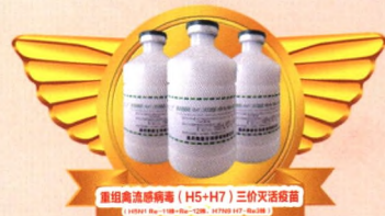
重组禽流感病毒(H5+H7)三价灭活疫苗 哈药集团生物疫苗有限公司