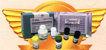
非洲猪瘟病毒ELISA抗体检测试剂盒 石家庄圣博生物科技有限公司