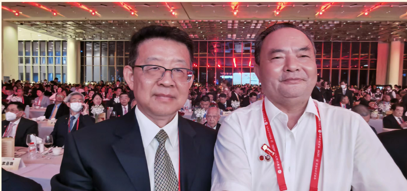
罗大友参加第十六届世界华商大会