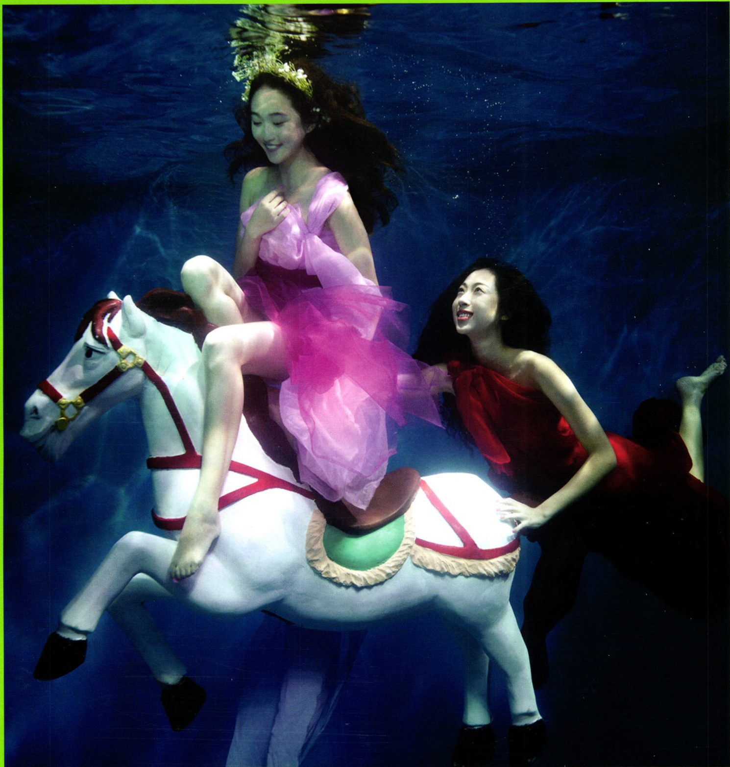
北京电影学院摄影学院商业班作业展作品《水·蕴》