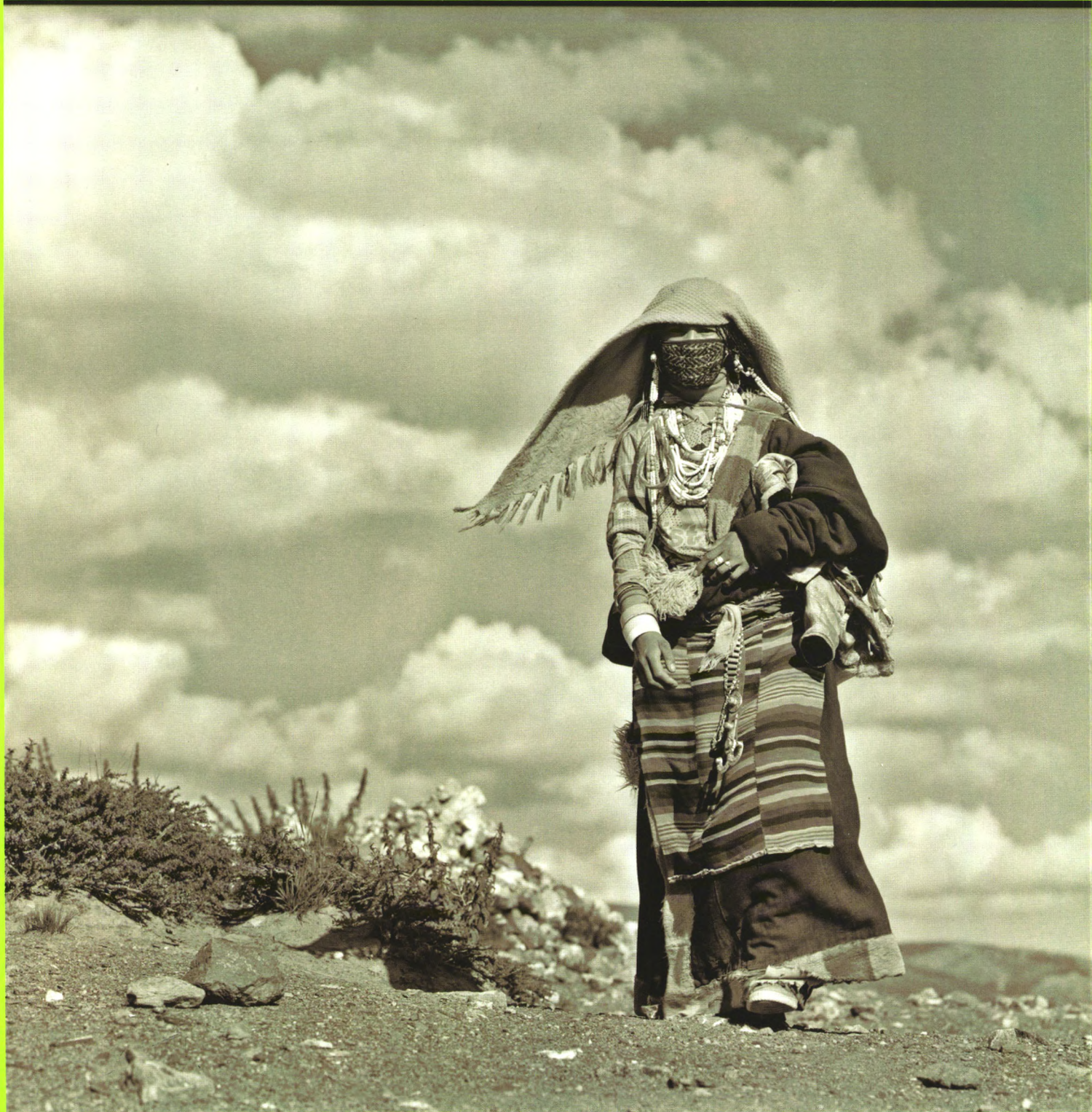
北京电影学院摄影学院师生作品展——北京国际摄影周2014年度系列展作品