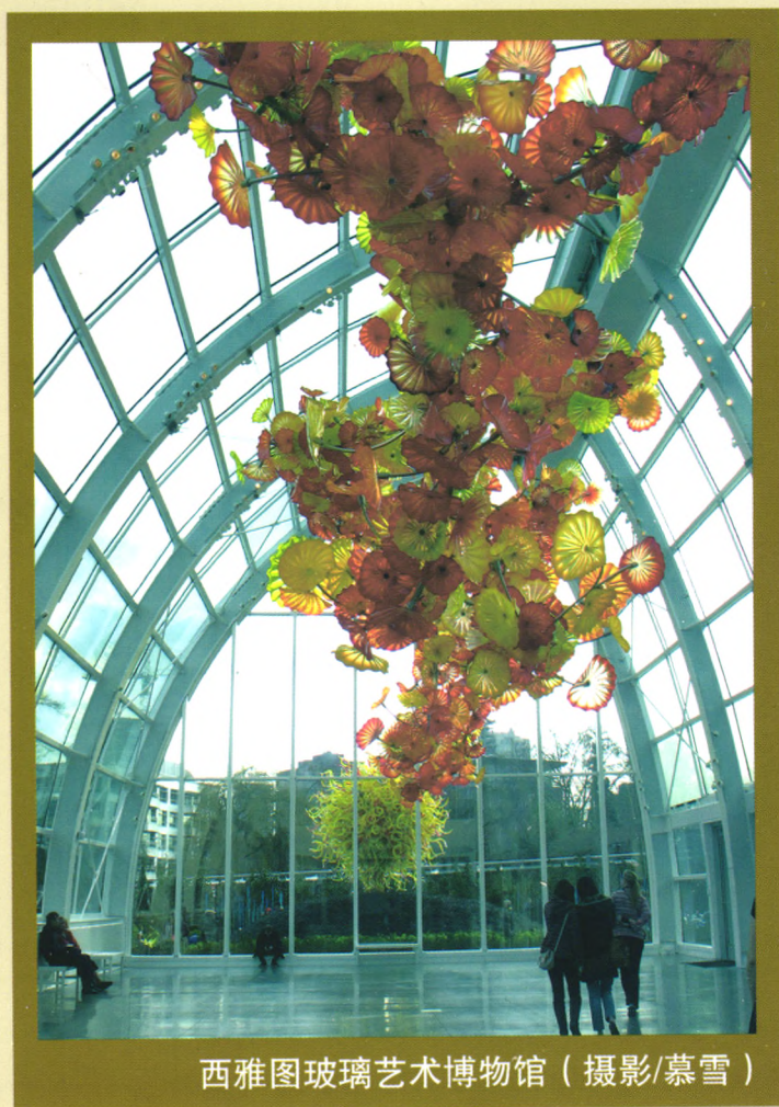
西雅图玻璃艺术博物馆