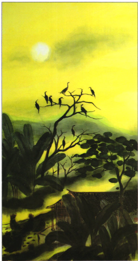
山深闻鹧鸪 纸本水墨