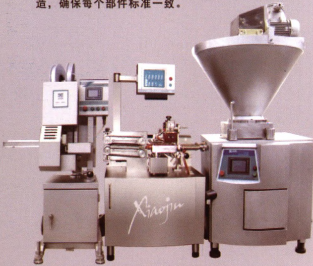
RZZY6000D / FIII型

装药范围 \phi 32 \sim \phi 45 mm，生产能力1200~1500 kg/h。