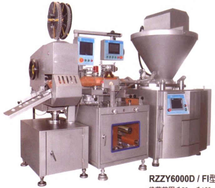
RZZY6000D / FI型

RZZY6000 Emulsion Explosive Auto Filling Machinery