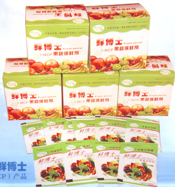
鲜博士 (1-MCP) 产品