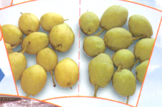
鲜博士处理 (右) 和未经鲜 博士处理 (左) 梨果实效果图