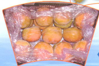
磨盘柿鲜博士处理后室 温存放20天的商品性