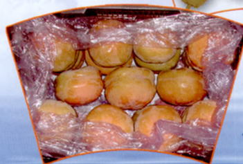
磨盘柿鲜博士处理后室 温存放20天的商品性