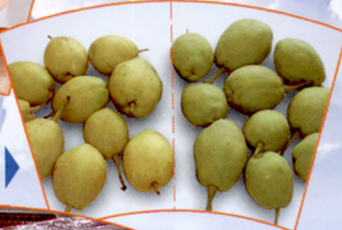
鲜博士处理（右）和未经鲜 博士处理（左）梨果实效果图