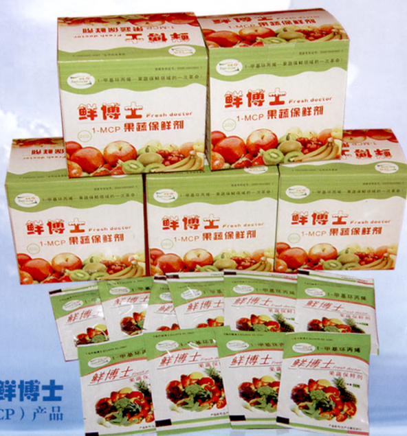
鲜博士 (1-MCP) 产品