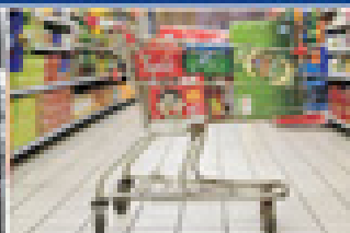
YOUNGSUN® 机器设备 与自动化处理和物流系统 成为必需品