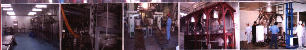
质量流量计量灌装设备 化工涂液调配系统设备 大桶自动封盖机组应用