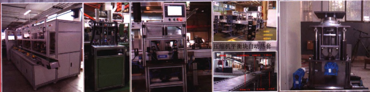
进水阀性能自动检测装配线 平衡块扭力检测设备 冰箱压缩机运转测试装备线 空调自动检漏装置