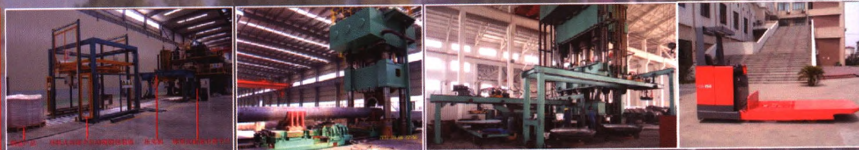
铜杆卷压实包装生产线