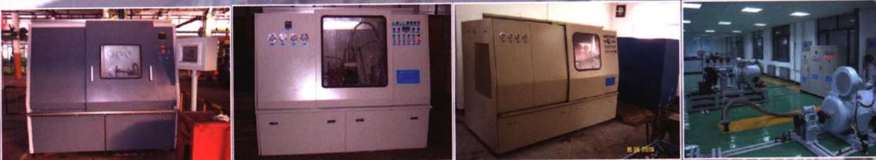
刹车泵在线快速检验装置