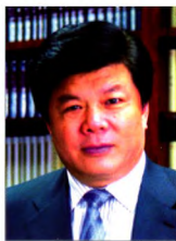
中国韬奋基金会理事长 高冀宁