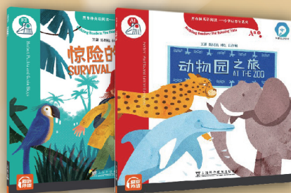
黑布林英语阅读——小学启思号