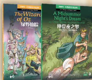
外教社牛津英语分级读物