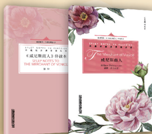
外教社经典伴读丛书