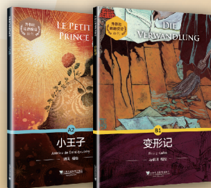
外教社多语悦读系列

外教社地址：上海市虹口区大连西路558号 总机：021-65425300 邮编：200083 网址：www.sflep.com Email：bookinfo@sflep.com