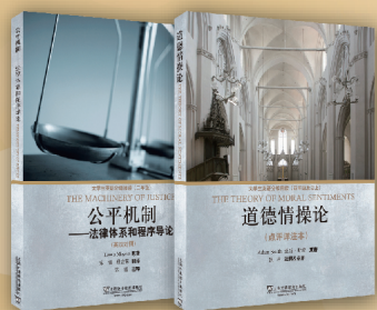
大学生英语分级阅读