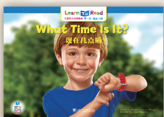
儿童英语阅读魔盒