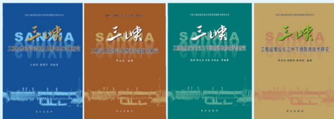
《三峡工程运用后泥沙与防洪关键技术研究丛书》（2011年国家出版基金项目）