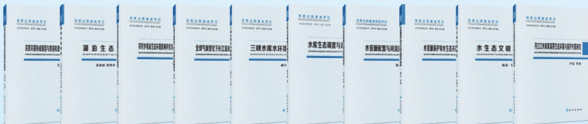
《水生态文明丛书》（2013年国家出版基金项目）