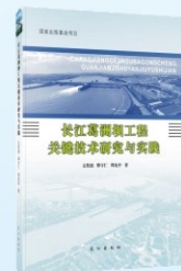
《长江葛洲坝水利枢纽工程关键技术研究》（2014年国家出版基金项目）