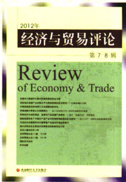
书名：(2012)经济与贸易评论第7—8辑 作者：柳思维 定价：68.00元 出版日期：2013年1月

内容简介：本书收录了10篇关于中国经济与贸易最近发展动向及研究的论文，论文基本上以实证研究为分析方法，内容涉及城市化、流通产业发展、城镇居民消费及储蓄、零售企业规模、低碳经济与绿色物流、农产品产业内贸易影响因素、消费品安全等多方面。书中还有“国际学术动态”及“科学观察栏目”。本书理论结合实践，对我国经济与贸易发展具有一定的指导和借鉴意义。