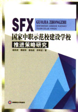
书名：国家中职示范校建设学校推进策略研究 作者：杨宗武等 定价：45.00元 出版日期：2013年1月

内容简介：本书以中国1981、1987、1992、1997、2002和2007年的投入产出数据为基础，编制这6年的非竞争型投入产出表，运用非竞争型投入产出模型研究各种需求因素对中国三次产业增长的影响。本书运用分配系数研究三次产业的中间需求结构和最终需求结构；在考虑产业完全关联作用的情况下，运用拉动系数研究三次产业的最终需求结构。通过与美国、日本和德国三次产业的市场需求结构进行比较，判断中国三次产业市场需求结构的可能变化趋势。本书理论结合实践，可读性强。