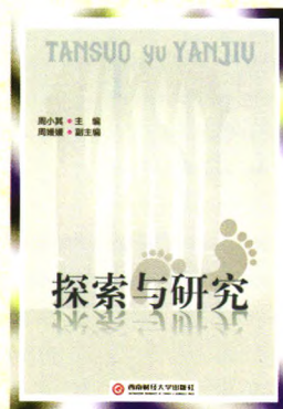
书名：探索与研究 作者：周小其 定价：49.80元 出版日期：2013年1月

内容简介：本书收录了10篇关于中国经济与贸易最近发展动向及研究的论文，论文基本上以实证研究为分析方法，内容涉及城市化、流通产业发展、城镇居民消费及储蓄、零售企业规模、低碳经济与绿色物流、农产品产业内贸易影响因素、消费品安全等多方面。书中还有“国际学术动态”及“科学观察栏目”。本书理论结合实践，对我国经济与贸易发展具有一定的指导和借鉴意义。