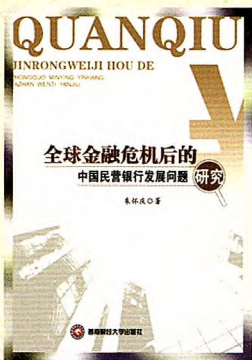
书名：全球金融危机后的中国民营银行发展问题研究 作者：朱怀庆 定价：25.00元 出版日期：2014年9月

内容简介：本书以社会保障相关理论和城乡关系为指导，从不同群体的就业特点以及城乡、地区之间经济发展水平发展不平衡的国情出发，采用规范分析法，研究了养老保障城乡统筹发展战略，进一步研究了城镇职工养老保障制度、城镇居民养老保障制度、农民工养老保障制度。该书理论结合实际，具有较高的学术价值，可读性强。