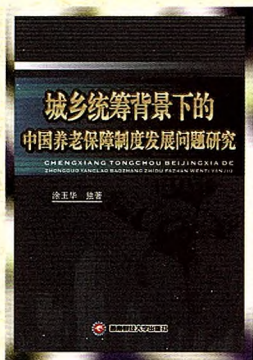
书名：城乡统筹背景下的中国养老保障制度发展问题研究 作者：涂玉华 定价：48.00元 出版日期：2014年9月

内容简介：本书用哲学的观点，分析了很多和金融相关的问题，从哲学的视角探讨现实经济社会中的金融现象和诸多问题，以一种新的眼光剖析常见的金融事件，给读者带来耳目一新的感觉。本书用大量生动的事例，给读者以新的思考方式思考金融理论，反思西方金融学热和当代金融危机。该书以随笔的形式，将哲学、金融理论娓娓道来，让人读后深受启迪。