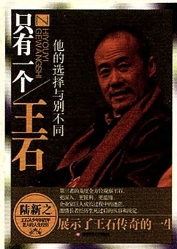
书名：只有一个王石——他的选择与别不同 作者：陆新之 定价：35.00元 出版日期：2014年8月

内容简介：中国企业家中，王石一直独树一帜，个性鲜明，行事作风与众不同，常常语出惊人。他对极限运动疯狂，爬过珠峰，穿越过两极和沙漠，也与死神擦肩而过，有着独特而深刻的人生体验和感悟。无论是在商界，还是在普通大众眼中，王石都极受追捧，甚至可以说是大众偶像。本书以第三者的角度全方位观察王石，更深入、更锐利、更温情地展现出企业家巨人成长过程中的迷茫，激励长者经历生死过后的从容和淡定。