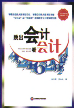
书名：跳出会计看会计 作者：李玉周 罗杰夫 定价：35.00元 出版日期：2016年8月

内容简介：本书摒弃了传统财务会计著作可操作性弱的特点，抛弃了传统会计人员局限于分录、报表的封闭性，构建了会计人员成长为财务管理精英的路径，同时纠正了社会对会计就是做账先生的认识，建立起会计人员的职能是“有意义的事业，有前景的生意”的概念。本书是一本上手即用的财会著作。