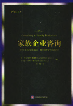
书名：家族企业咨询 作者：肖柳 定价：68.00元 出版日期：2016年10月

内容简介：本书立足于经济新常态下农业供给侧改革背景与中国现代农业转型趋势的立题角度，分析四川省农业产业化发展的整体概况，以及产业化主体（经营主体和服务主体）发展情况；重点针对四川省农业产业化的产供销、投融资以及管理问题进行分析，并收集和总结四川省成功案例经验，结合农业供给侧改革要求，提出进一步发展农业产业化的对策建议。本书的出版，揭示了供给侧改革背景下我省农业产业化发展趋势，为四川省农业产业化发展提出了科学的指导意见。