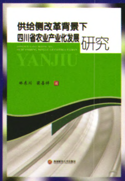
书名：供给侧改革背景下四川省农业产业化发展研究 作者：林东川 梁善祥 定价：78.00元 出版日期：2016年9月

内容简介：本书意在生态文明思想指导下对人口城市化过程进行理论研究，并分析中国人口城市化过程的演进、特征、影响等问题。本书内容对人口城市化理论进行拓展，提出了人口城市化过程具有特定的结构，为更深入理解现实中的人口城市化提供更为全面视角的理论支撑，具有一定理论价值。