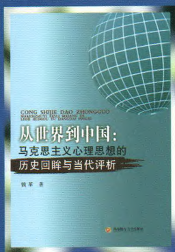
书名：从世界到中国：马克思主义心理思想的历史回眸与当代评析 作者：钱 gang 定价：88.00元 出版日期：2015年12月

内容简介：本书对我国试点地区政策性农业保险的经营模式进行了异同比较与发展潜力分析；基于江苏和吉林省的实地调研数据，重点分析了保险公司和农户的承（投）保现状、意愿及影响因素等主体行为，并从农户角度对政策性保险的绩效进行评价；构建了平衡计分卡框架下的农险保费补贴资金绩效评价指标体系；借鉴了农险开展的国际经验。