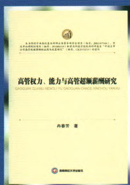
书名：高管权力、能力与高管超额薪酬研究 作者：冉春芳 定价：68.00元 出版日期：2016年1月

内容简介：本书立足于中国人口转变加速发展的背景，以实现城乡社会养老保险制度可持续发展为总体目标，综合运用人口经济学、博弈论及精算科学的方法，着重厘清人口转变、产业转型升级与城乡社会养老保险制度可持续发展的理论逻辑，对现行城镇职工基本养老保险制度的长期财务平衡进行精算测定，对城镇职工基本养老保险制度优化方案进行政策模拟，并重点研究了城乡社会养老保险制度的长效机制建设问题。其研究框架和内在理论逻辑对推动可持续养老保险制度研究具有一定的学术价值。