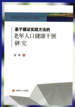
书名：基于循证实践方法的老年人口健康干预研究 作者：童峰 定价：68.00元 出版日期：2016年5月

内容简介：人口老龄化是当今全球人口发展的趋势。随着人口老龄化加剧，如何使得老年人口在衰老过程中保持较高健康水平引起学术界的广泛关注。为此，本书聚焦于讨论老年人口健康问题的干预措施，以缓解社会老龄化问题。本书对于解决我国人口发展、破解人口老龄化问题具有重要的理论意义和实践指导意义。