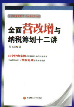
书名：全面营改增与纳税筹划十二讲 作者：贺飞跃 定价：38.00元 出版日期：2016年5月

内容简介：本书主要介绍了广西少数民族文化的起源、发展与传承。如刘三姐、铜鼓、壮族三月三歌节、漓江画派等16个项目，分16章从它们的文化起源，到历史发展、传承现状，一直介绍到如今的保护制度与措施。本书对于研究广西少数民族文化以及继承发扬广西少数民族文化具有深远而重大的意义。