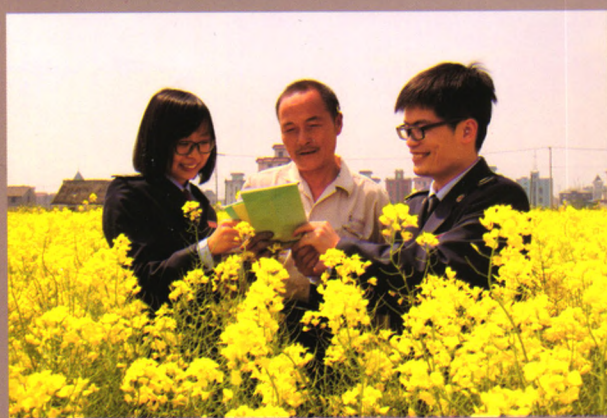
税务干部服务纳税人