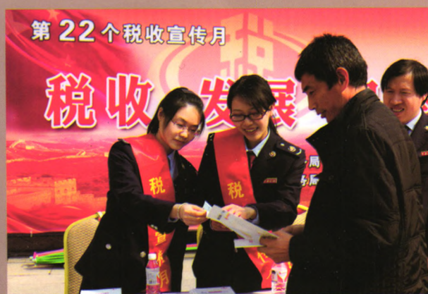
税务干部宣传营改增相关政策