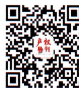
《产权导刊》公众号二维码

为了更好地服务读者,《产权导刊》已开通微信公众号、微店以及融媒体平台。扫描以下二维码即可访问,随时随地购买纸质期刊、电子期刊,观看视频(直播),阅读优秀文章,并及时获取各类资源、信息等。