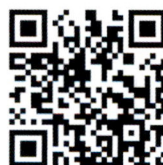
《产权导刊》微店二维码