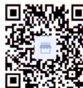
《产权导刊》融媒体平台二维码