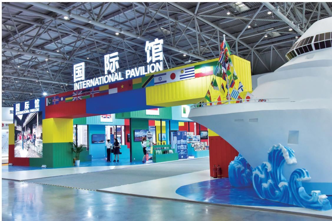
西洽会国际展馆亮点纷呈。