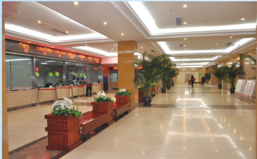
九龙坡区人民医院B区大厅环境