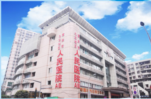
九龙坡区人民医院A区