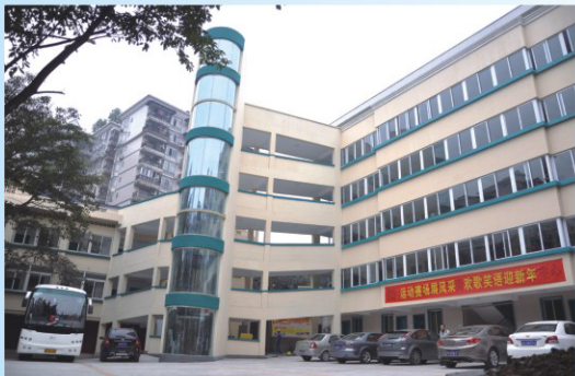
九龙坡区人民医院C区