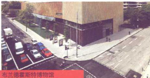
P062 布兰德霍斯特博物馆

封二 金算盘 001 东芝电脑 003 重庆市规划设计研究院 005 热度旅游网 006 国家历史杂志 封三 环球人文地理 封底 奔驰汽车