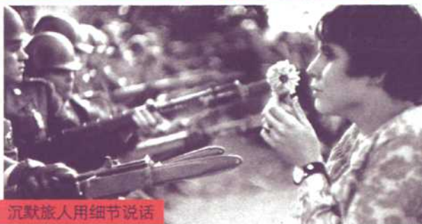
P116 沉默旅人用细节说话