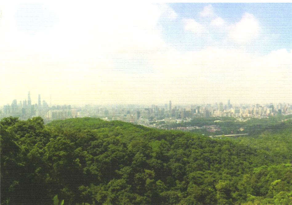
白云山与广州的新老城区、城市的新中轴线和谐交融。