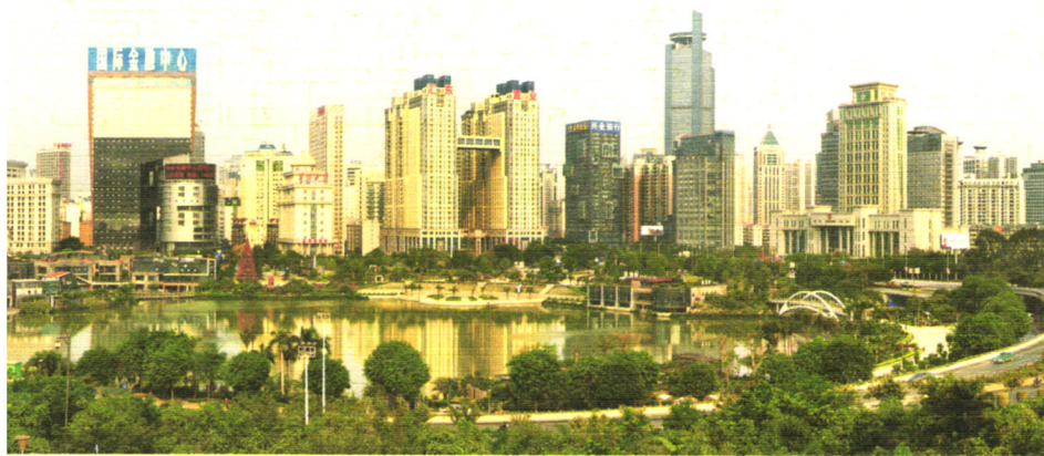
绿树环绕中的民歌湖，曾经的南宁国际民歌节主会场现已成市民休闲娱乐场所。