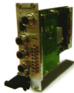
CPGS-9120-M12-C 3U 12 口网管型全千兆 CompactPCI 交换机, EN50155