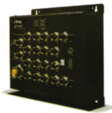
TPS-3162GT-M12-BP1 工业级 18 口网管型 PoE 以太网交换机 EN50155