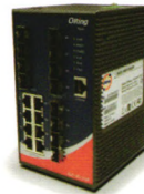
IGS-9812GP 工业级 20 口 千兆网管型 以太网交换机