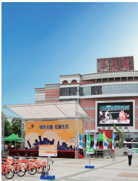
封面图片: 2010年中国城市无车日活动

住房和城乡建设部于2010年9月22日继续在全国范围内开展中国城市无车日活动,自2007年首次开展该活动以来,至今已经连续开展四届,活动承诺城市已增加至129个,城区受众人口达2.67亿。活动每年都会聚焦于一个与交通可持续发展相关的主题,2010年活动主题为:绿色交通,低碳生活。“低碳”不仅是一个气候、环境问题,更是一种新的可持续发展方式、能源消费方式和生活方式。“绿色”仅就日常出行而言,即尽可能地选择步行、自行车、公共交通等出行方式,降低对小汽车交通的依赖。选择对环境影响最小、能耗最低的出行方式和积极健康的生活方式,最终受益者将是城市和居民自己。