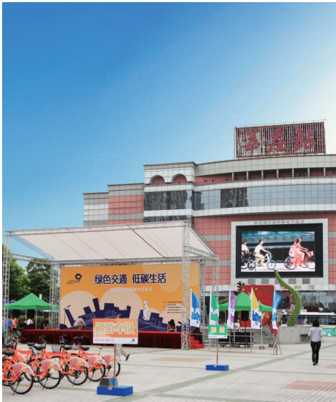
Cover Picture: National Urban Car-Free Day, 2010