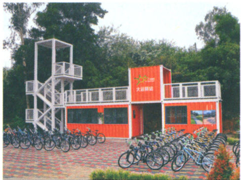
利用废旧集装箱建设的设施