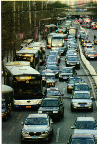
Cover Picture: The Progressive Development of Public Transit System in Beijing