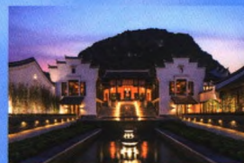
阳朔悦榕庄度假酒店荣获中国建筑工程装饰奖