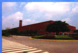
宝骏乘用车搬迁一期技术改造项目涂装车间荣获国家优质工程奖