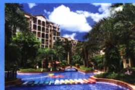
彰泰·兰乔圣菲荣获鲁班奖