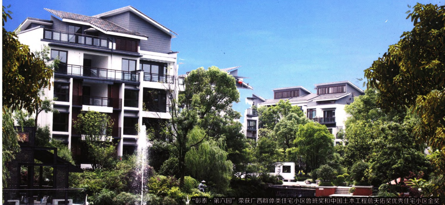
“彰泰·第六园”荣获广西群体类住宅小区鲁班奖和中国土木工程詹天佑奖优秀住宅小区金奖