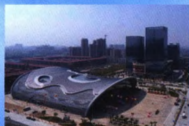
阳江国际会展中心荣获中国钢结构金奖