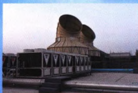
桂林市正阳东巷历史地段及解放东路（局部）旧城改造项目空调安装工程荣获中国安装工程优质奖（中国安装之星）