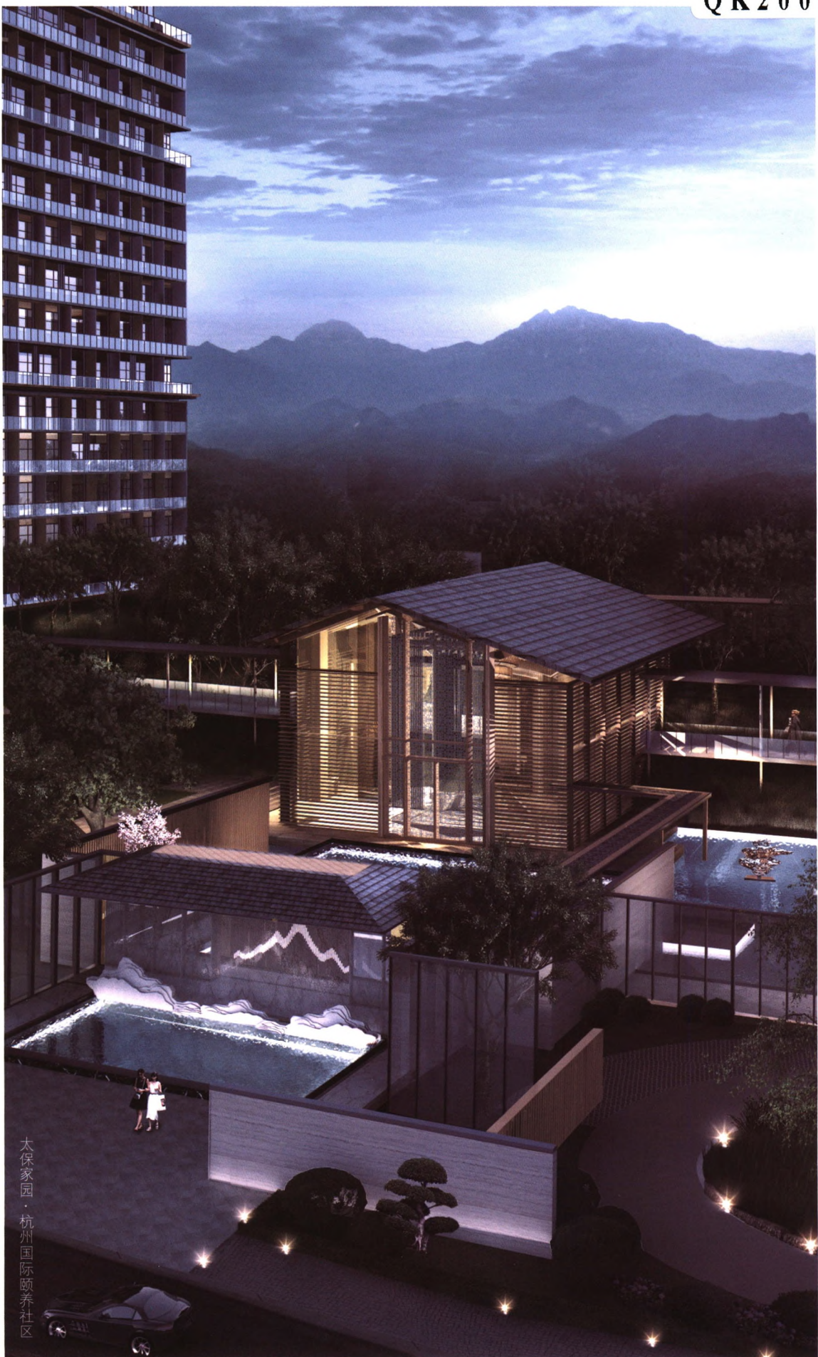
太保家园·杭州国际颐养社区