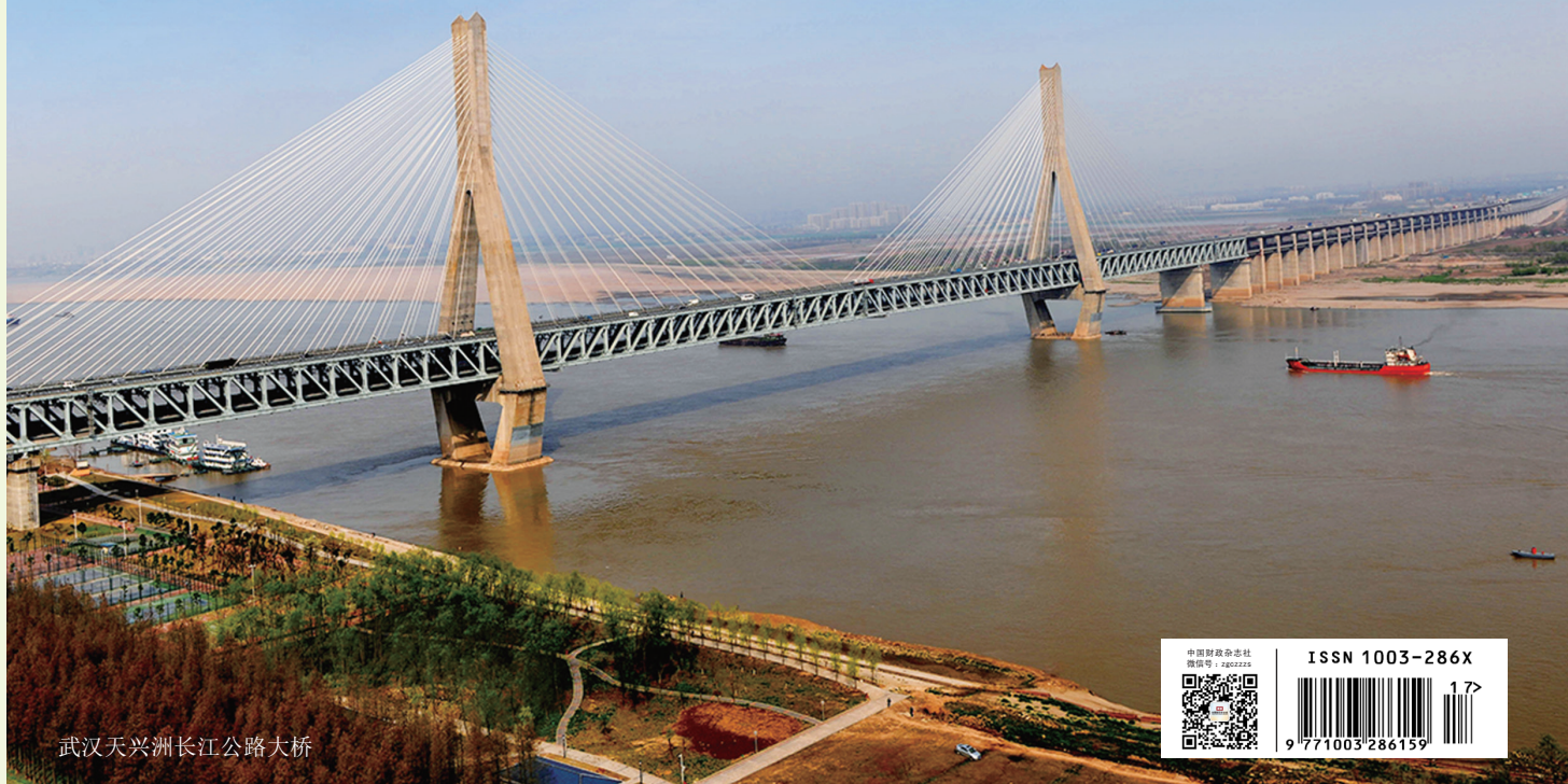
武汉天兴洲长江公路大桥