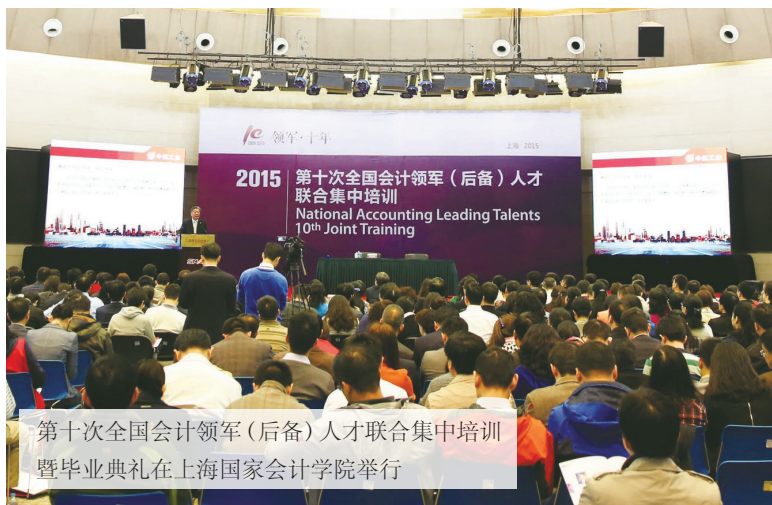
第十次全国会计领军(后备)人才联合集中培训暨毕业典礼在上海国家会计学院举行