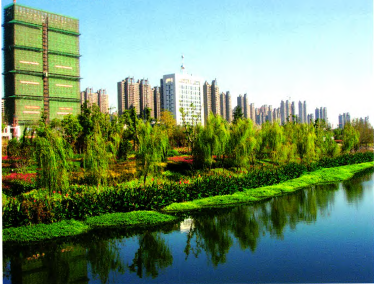
合肥塘西河河畔美景