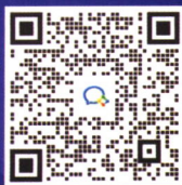
三里河路九号平台交流群

《建筑》邮局订阅代号 2—83 每期定价 40 元，全年 12 期定价 480 元