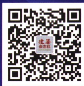
欢迎关注我社微信公众号