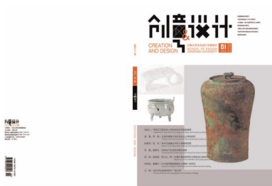
封面设计：陈原川，李曼雪