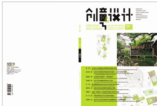
封面设计：陈原川，张峰源