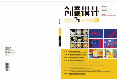
封面设计：陈原川，张峰源