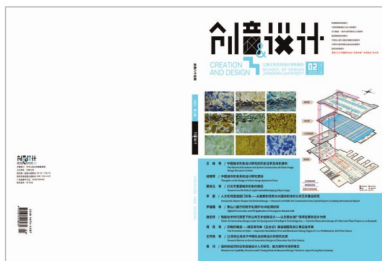
封面设计：杨心语，杨夏宇