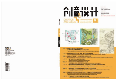
封面设计：卞思宇，林书玉