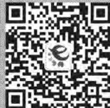
“读者服务之家” 微信公众号