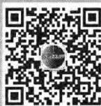
《初中生世界》 微信公众号

2.其他报刊转载本刊作品,请注明并及时通知本刊,否则本刊有权依据国家有关法律法规追究其法律责任。