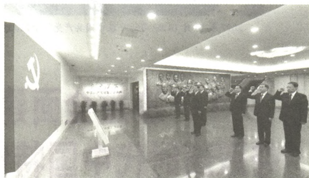
2017年10月31日,中共中央总书记、国家主席、中央军委主席习近平带领中共中央政治局常委李克强、栗战书、汪洋、王沪宁、赵乐际、韩正,瞻仰上海中共一大会址和浙江嘉兴南湖红船。这是31日上午,在上海中共一大会址纪念馆,习近平带领其他中共中央政治局常委同志一起重温入党誓词。