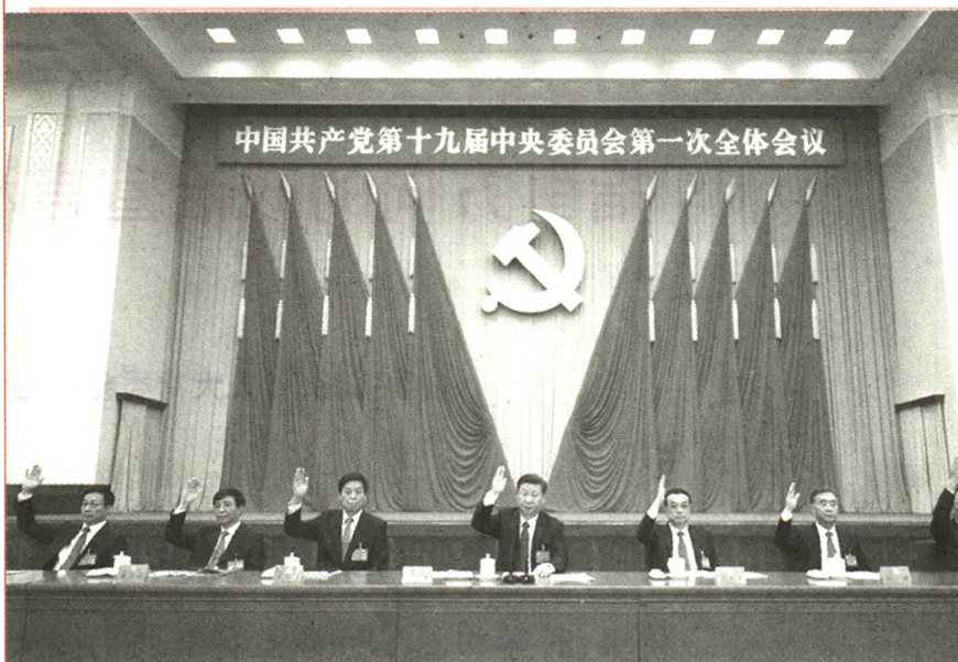
2017年10月25日,中国共产党第十九届中央委员会第一次全体会议在北京人民大会堂举行。习近平、李克强、栗战书、汪洋、王沪宁、赵乐际、韩正等出席会议。