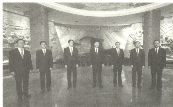
2017年10月31日,中共中央总书记、国家主席、中央军委主席习近平带领中共中央政治局常委李克强、栗战书、汪洋、王沪宁、赵乐际、韩正,瞻仰上海中共一大会址和浙江嘉兴南湖红船。这是31日下午,习近平在南湖革命纪念馆参观结束时发表重要讲话。