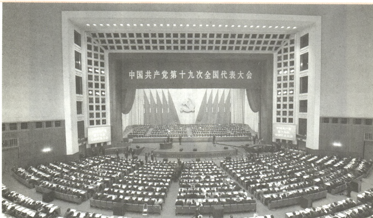
2017年10月18日，中国共产党第十九次全国代表大会在北京人民大会堂开幕。习近平代表第十八届中央委员会向大会作报告。